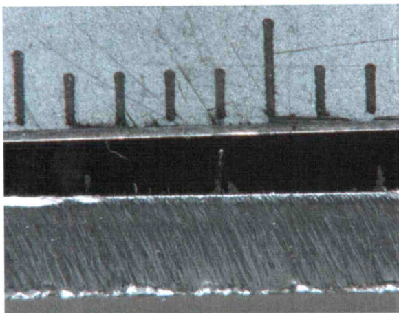
Abbildung 2 Schnittqualität der Probe am geraden Schnitt