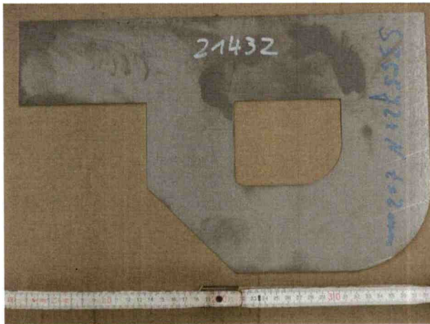
Abbildung 1 Ansicht der Probe mit geradem Schnitt, scharfkantige Ecke und kurvenförmigem Bogen entsprechend DIN EN 1090-2:2018-09 Abschnitt 6.4.3