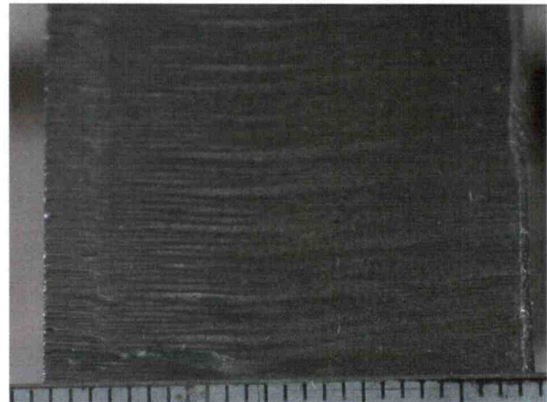
Abbildung 3 Schnittqualität der Probe am bogenförmigen Schnitt

Die Schnittflächen des geraden und des bogenförmigen Schnittes sowie die scharfkantige Ecke zeigen visuell eingeschätzt großflächig keine unterschiedliche Qualität.