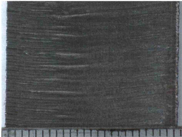
Abbildung 2 Schnittqualität der Probe am geraden Schnitt