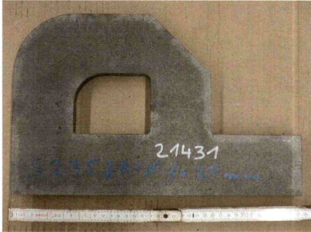
Abbildung 1 Ansicht der Probe mit geradem Schnitt, scharfkantige Ecke und kurvenförmigem Bogen entsprechend DIN EN 1090-2:2018-09 Abschnitt 6.4.3